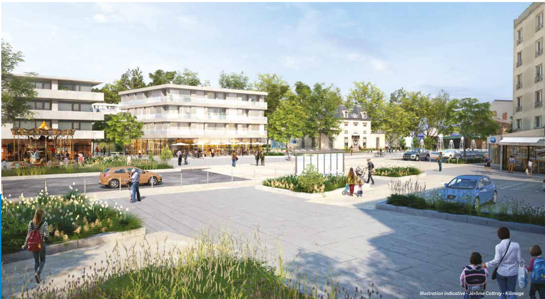
Illustration indicative - Jérôme Cotray - Killimage