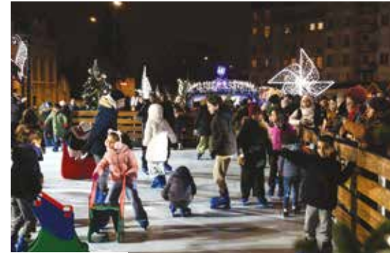
Festivités de Noël