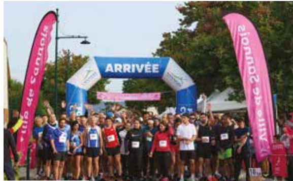
Foulées de Cyrano