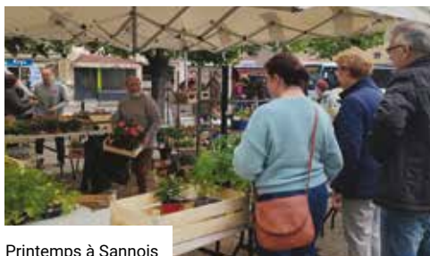
Printemps à Sannois