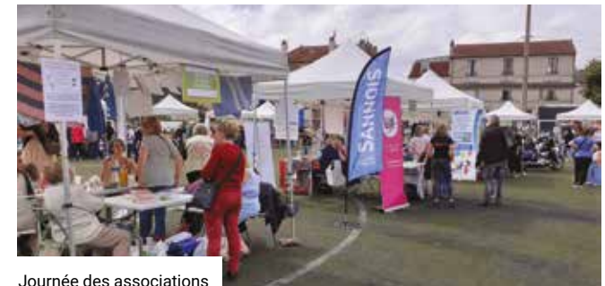
Journée des associations