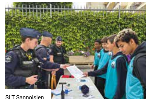
Si T Sannoisien