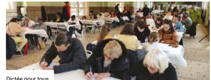
Dictée pour tous