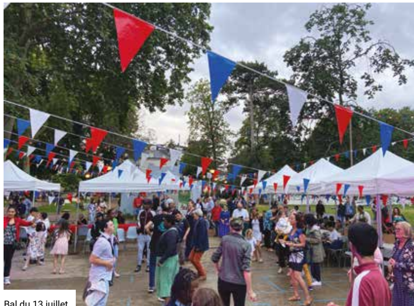
Bal du 13 juillet