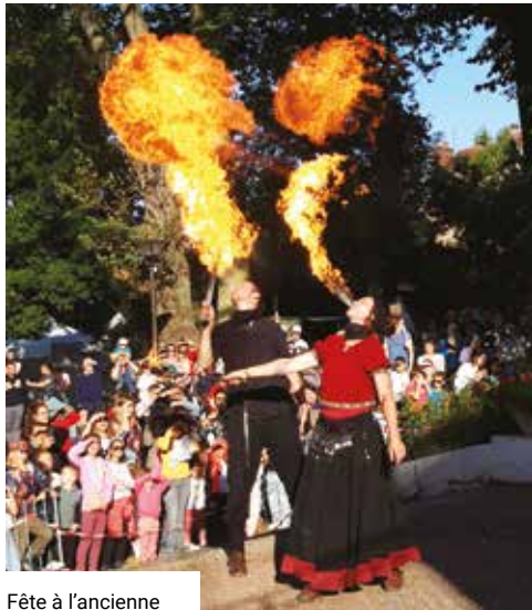
Fête à l'ancienne