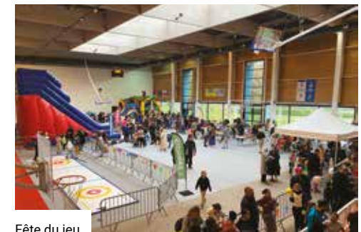
Fête du jeu