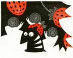
© Rephaëlle Enjary - Galerie Hochillard

19h-21h PROJECTION DE COURTS-MÉTRAGES DU FESTIVAL "LES MOULINS D'OR"