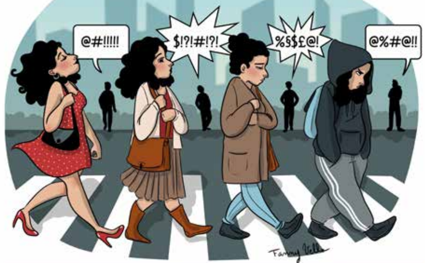
60 % des femmes affirment adapter leurs tenues pour ne pas créer une situation à risque.