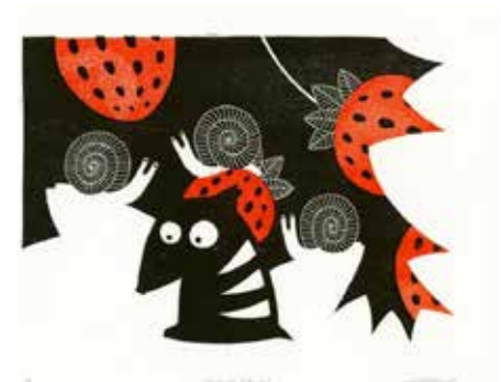
© Raphaële Enjary - Galerie Robillard

Vive la magie des couleurs avec l'univers très graphique de la série Zébulon des éditions MeMo ! Cette exposition, présentée à la maison des loisirs et des arts, est l'occasion d'aborder des thématiques éco-responsables autour de la nature et du monde qui nous entoure avec créativité et jeu.