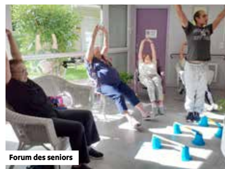
Forum des seniors

► Espace Fernand Coutif - 8, rue François Moreels Entrée libre