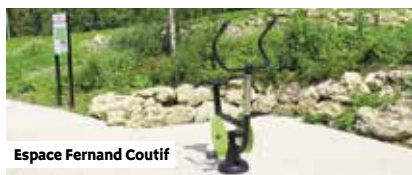
Espace Fernand Coutif