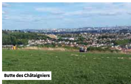
Butte des Châtaigniers

Découvrez la butte du mont Trouillet en empruntant les petites rues qui mènent jusqu'au moulin. Vous pourrez admirer ce monument historique de la ville, la vigne et la vue sur Paris.