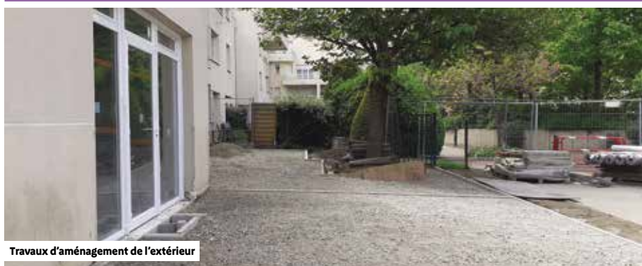
Travaux d'aménagement de l'extérieur

S uite à l'acquisition d'un appartement contigu, le multi-accueil Les Tilleuls bénéficie d'une extension de 85 m 2 portant sa superficie à 420 m 2 et sa capacité d'accueil à 35 places contre 20 places jusqu'à présent. Les travaux ont débuté à l'automne et seront terminés en juillet afin de permettre une ouverture de l'équipement le 26 août.