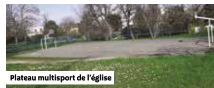
Plateau multisport de l'église