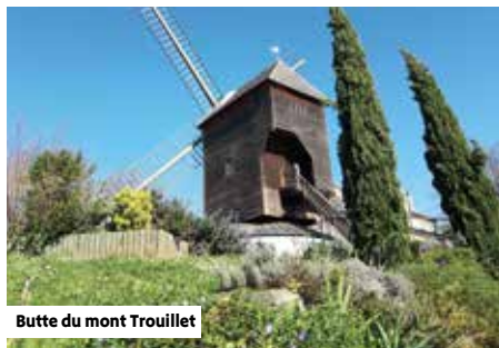
Butte du mont Trouillet