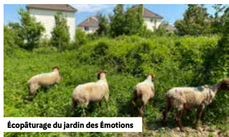
Écopâturage du jardin des Émotions

La ville embellit votre environnement et améliore votre quotidien. En effet, les Sannoisiers vont pouvoir profiter d'un nouvel espace vert avec le jardin des Émotions qui ouvrira fin septembre. D'une superficie de 3 700 m 2 , il est situé rue du Capitaine de Pauw, dans le quartier Pasteur.