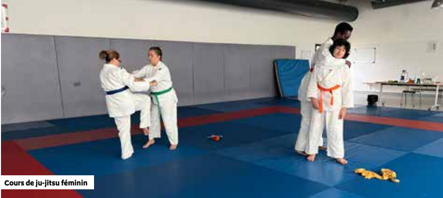
Cours de ju-jitsu féminin