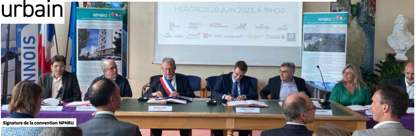
Signature de la convention NPNRU

La transformation des quartiers du Bas des Aulnaies et des Carreaux Fleuris va s'accélérer avec la signature récente du programme de renouvellement urbain. Une bonne nouvelle pour leurs habitants.