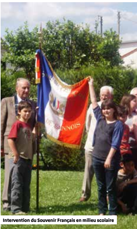
Intervention du Souvenir Français en milieu scolaire

L e Souvenir Français est un partenaire officiel de l'Éducation nationale dans ses objectifs de construire une mémoire collective autour de valeurs partagées et ainsi contribuer au sentiment d'appartenance commune pour le vivre ensemble. Quoi de plus naturel, alors, que de présenter le drapeau national et la symbolique de ses trois couleurs. Emblème national de la Cinquième République, le drapeau tricolore est né sous la Révolution française, de la réunion des couleurs du roi (blanc) et de la ville de Paris (bleu et rouge). Aujourd'hui, le drapeau tricolore flotte sur tous les bâtiments publics. Il est déployé dans la plupart des cérémonies officielles, qu'elles soient civiles ou militaires.